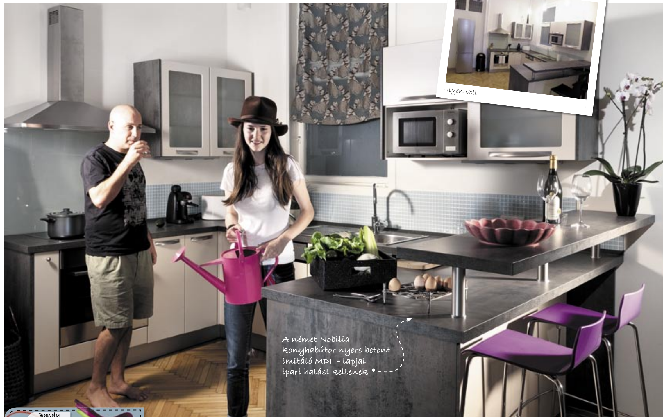
A német Nobilia konyhabútor nyers betont imitáló MDF - lapjai ipari hatást keltenek